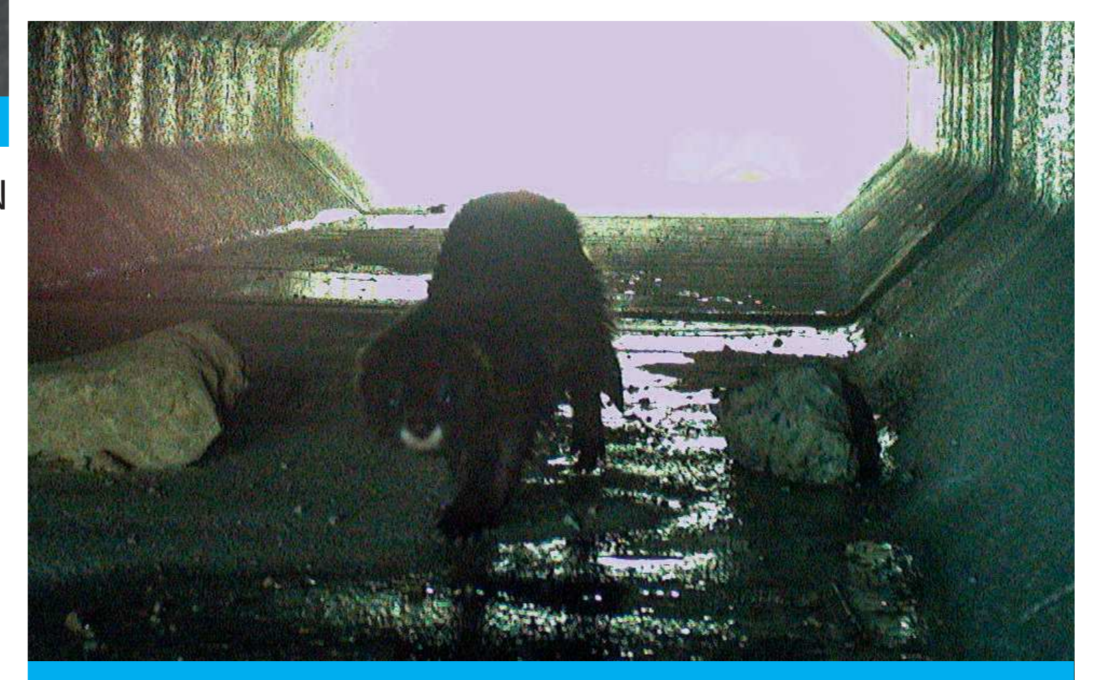
Vison d'Europe

Nul doute que cet aménagement unique pourra servir de modèle pour d'autres gestionnaires de route en France qui souhaitent rétablir des continuités écologiques en zone humide.