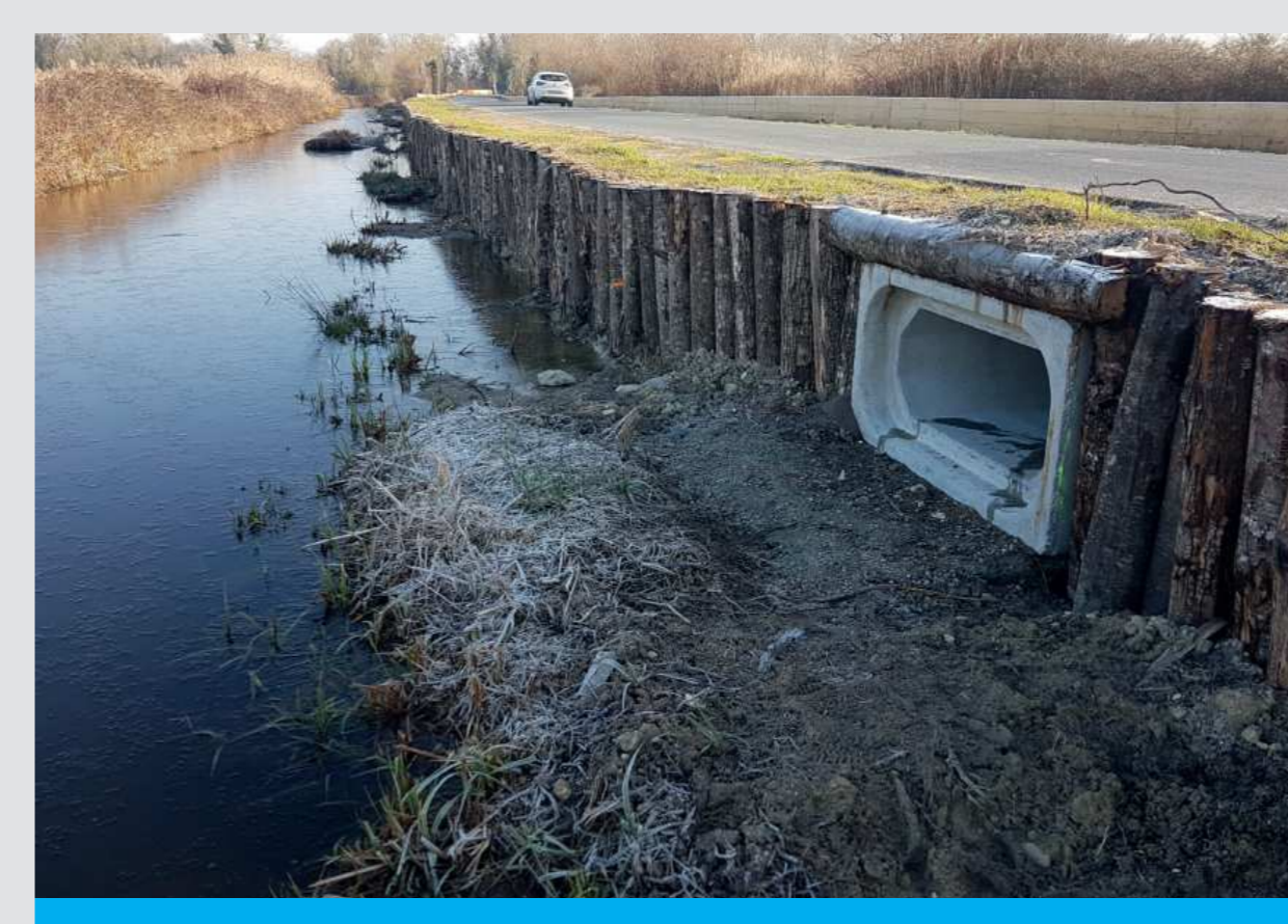
Dalot de 40x100 cm, pieutage de 80 cm de hauteur et palissades bois (de l'autre côté de la route) pour éviter la traversée de la faune.

Afin de guider les animaux vers ces passages sécurisés, le linéaire a été équipé de palissades en bois et/ou du pieutage de berge, dissuadant ainsi la faune de remonter sur la route tout en garantissant une bonne intégration paysagère et un conformement pérenne des berges soumis à l'érosion.