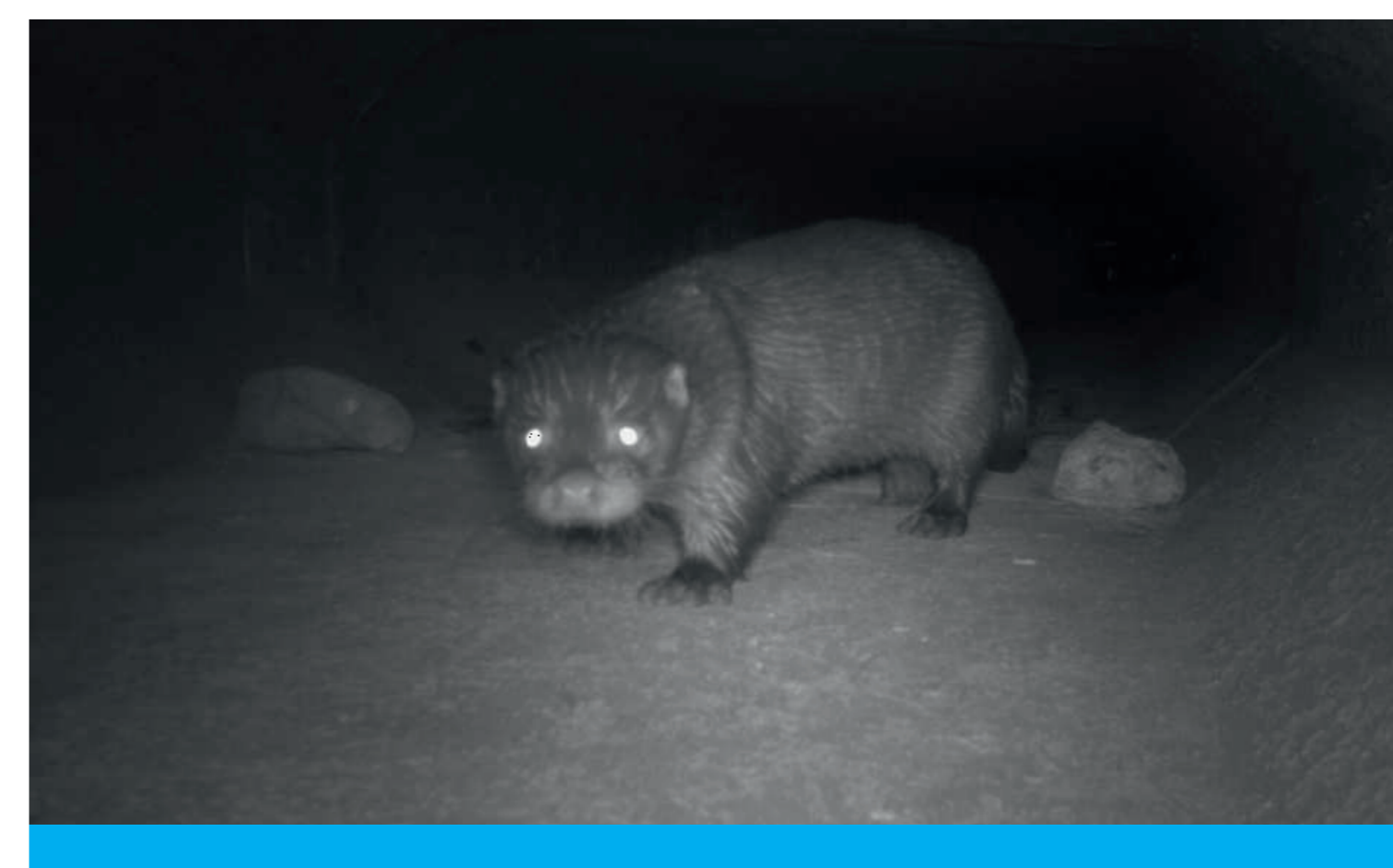
Loutre d'Europe

Cet aménagement achevé en 2023 est d'ores et déjà une grande réussite. Les suivis scientifiques menés montrent que les dalots sont déjà bien empruntés par le Vison d'Europe, et ce dès les premiers jours, ainsi que par un large cortège d'espèces du marais : Loutre d'Europe, Belette d'Europe, Campagnol amphibie, Blaireau européen, Hérisson d'Europe, reptiles, amphibiens, etc.