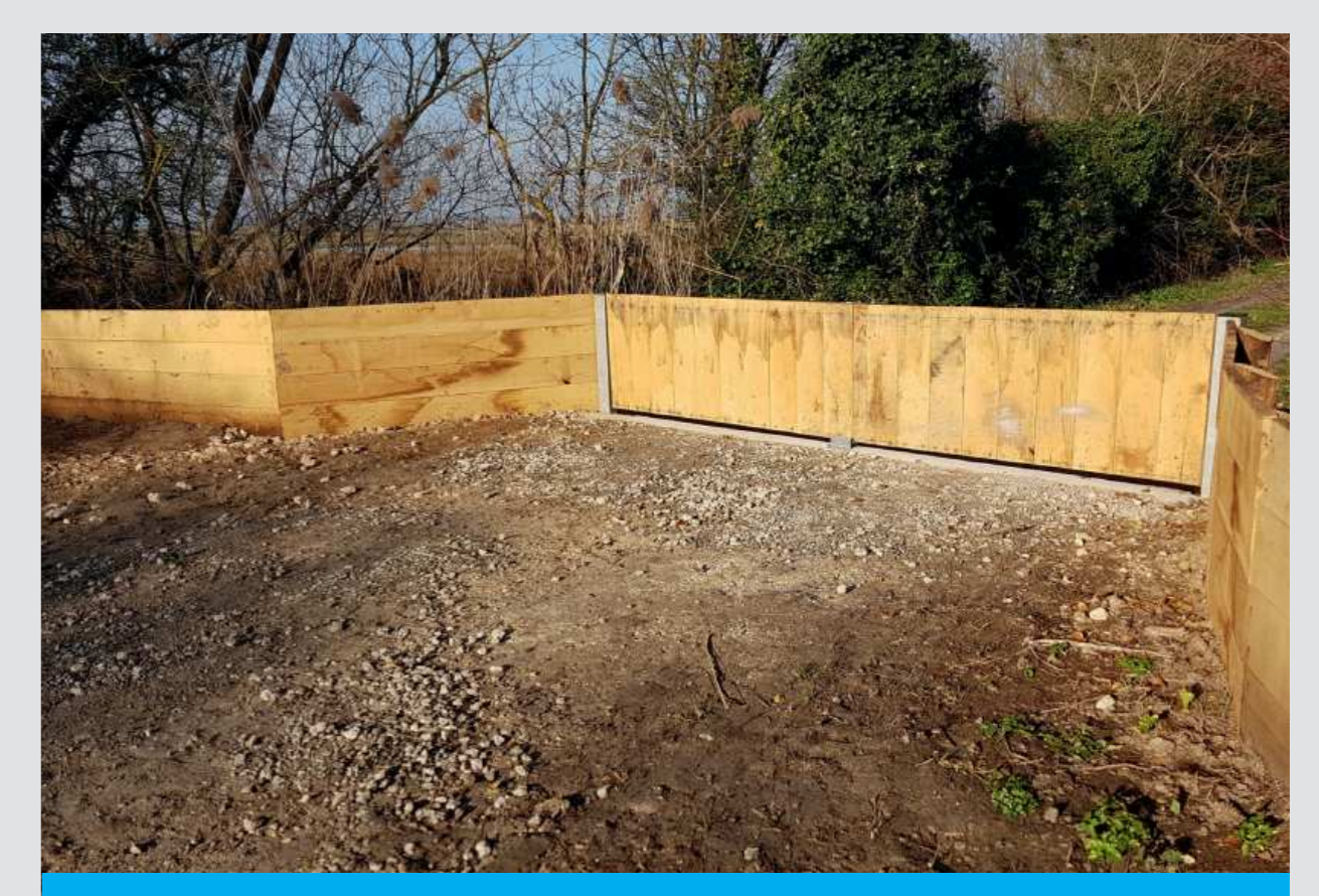
Portails installés pour permettre l'accès aux parcelles tout en maintenant une protection efficace.